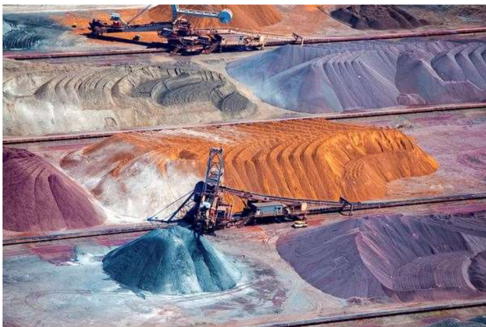
Металлы всех цветов и добывающие компании несут потери.

В дальнейшем цена золота будет зависеть от некоторых факторов, в частности от траектории процентной ставки в США, учитывая, что Федеральный комитет по операциям на открытом рынке в последнее время был настроен на ужесточение условий более решительно, чем участники рынка. Другим важным фактором направления движения золота является курс доллара. Некоторые эксперты, в том числе руководитель отдела валютных стратегий в нашем банке, теперь ожидают, что в течение нескольких месяцев доллар достигнет паритета с евро . А подъем доллара, безусловно, негативно скажется на цене золота. С другой стороны, искусственные закупки золота центральными банками и сокращение объемов добычи может оказать металлу поддержку.