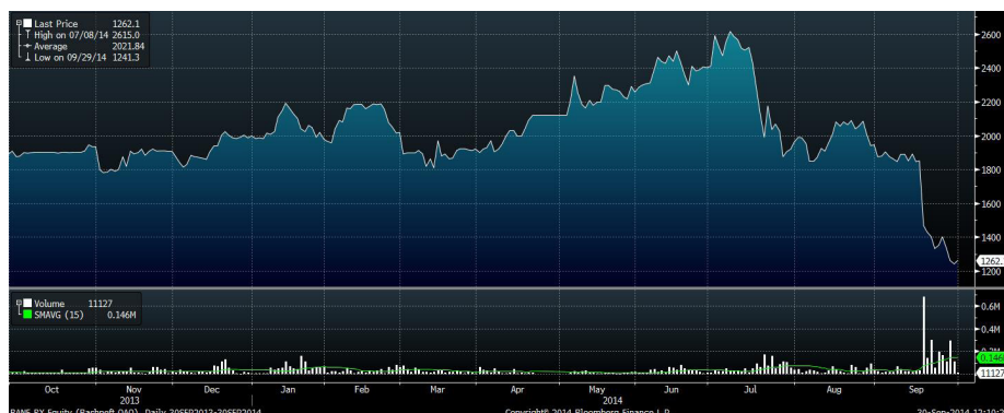
Рис.2 Динамика акций «Башнефти» за год