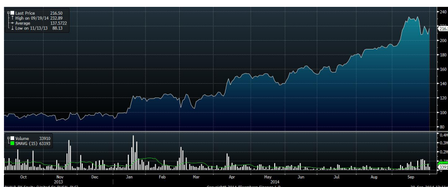
Рис.4 Динамика акций «РУСАЛа» за год

В начале минувшей недели слабо выглядели бумаги «РУСАЛа». Во вторник они снизились более чем на 8%. ВЭБ нуждается в средствах, и возможен обратный выкуп эмитентом акций «РУСАЛа» по цене приобретения (22.9 млрд рублей). ВЭБ приобретал акции на IPO в Гонконге с надеждой заработать на этом вложении, но с января 2010 года получил 12 млрд бумажного убытка. О договоренностях ВЭБа и «РУСАЛа» неизвестно, но возможно, они действительно предусматривают обратный выкуп бумаг, считают аналитики ИГ «Норд-Капитал».