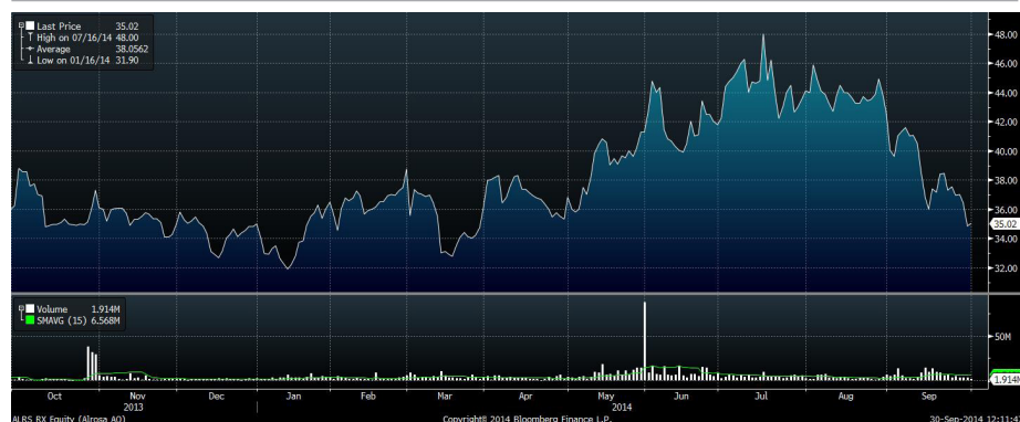
Рис.7 Динамика акций «АЛРОСА» за год

«АЛРОСА» в четверг объявила о планах объединения своих гранильных предприятий на базе барнаульского завода «Кристалл» и площадки в Москве по обработке особо крупных и цветных алмазов. Это подтверждает предположение ИГ «Норд-Капитал» о переориентации компании в сторону внутреннего сбыта и создания ограниченного производства, при этом инвестирование в добычу и экспорт алмазов могут быть уменьшены. Это негативно скажется на финансовых показателях «АЛРОСА» - добывающий бизнес наиболее маржинальный, а стоимость камней на экспортных рынках выше, чем на внутреннем. Видимо, именно с этим связано снижение акций алмазной компании на фондовом рынке (-22% с начала года).