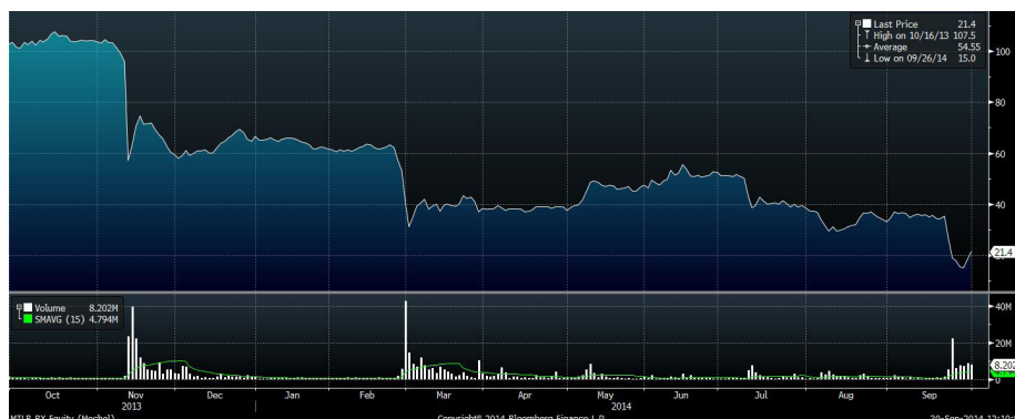
Рис.3 Динамика акций «Мечела» за год