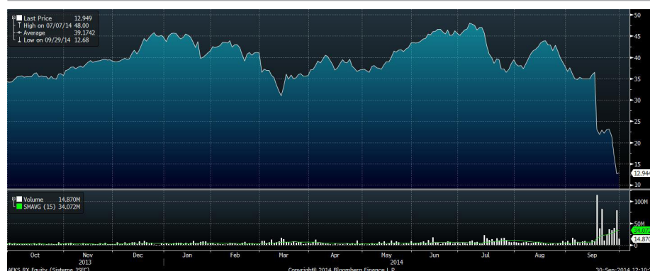
Рис.1 Динамика привилегированных акций АФК «Система» за год

В четверг Мосгорсуд отклонил апелляцию главы АФК «Система» на домашний арест. А в пятницу Арбитражный суд арестовал акции «Башнефти», принадлежащие АФК «Система» и «Система-Инвест». Таким образом, итоги приватизации «Башнефти» пятилетней давности могут быть пересмотрены. Если отчуждение предприятий ТЭК в Республике Башкортостан будут признаны незаконными, то компания может быть продана ещё раз. Например, кому-то из государственных нефтегазовых холдингов. «Башнефть» обладает интересными перерабатывающими активами и завершила фазу больших капитальных вложений в месторождение Требса и Титова. Исходя из этого, она может быть интересна «Роснефти». По итогам недели «Система» подешевела на 25%, а «Башнефть» - на 12%.