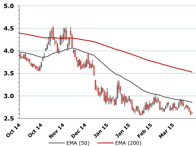
Природный газ Henry Hub, долл./ММВТУ*