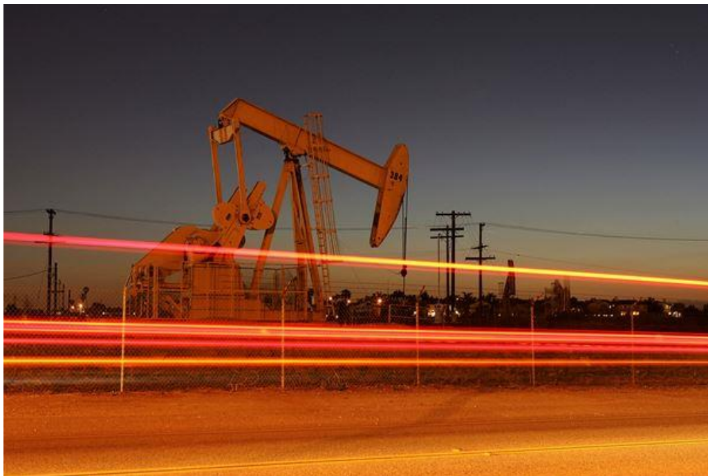
Спекулянты увеличили ставки на рост цены на нефть WTI.

У другого популярного фонда VelocityShares triple long (UWTI) дела обстоят еще хуже. С начала года он понизился на 30%, и только по причине одного этого фонда за последний месяц с рынка было выведено свыше 500 миллионов долларов.