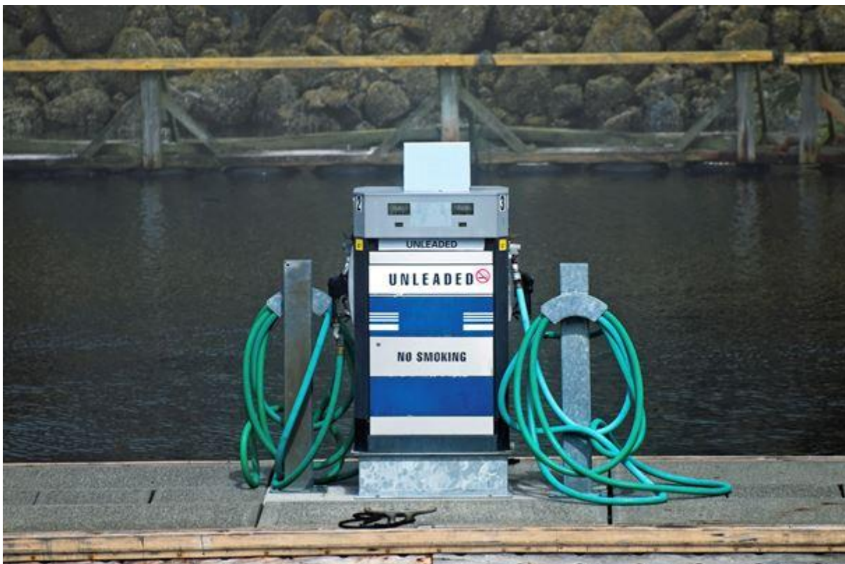
Темпы добычи сырой нефти в США будут падать быстрее, чем ожидает правительство, говорят EOG.

На прошедшей неделе поддержку нефти оказывало несколько факторов. Помимо уменьшения количества действующих буровых вышек в США, компания EOG Resources (EOG:хпys), крупнейшее в США предприятие по освоению сланцевых месторождений, заявила в квартальном отчете, что темпы добычи в США будут падать быстрее, чем ожидает правительство.