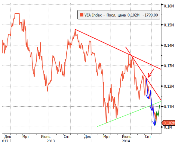
Рис.3 Фьючерс на индекс РТС