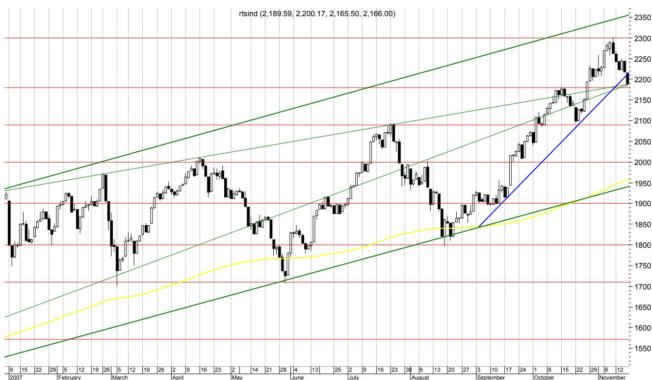
Динамика индекса РТС, 29 декабря 2006 – 16 ноября 2007

Большая часть прошлой недели (12 – 16 ноября) прошла на российском рынке акций под знаком снижения котировок. Негативные настроения поддерживались разнонаправленной динамикой внешних рынков акций, в фокусе внимания которых оставалась ситуация в финансовом секторе, и коррекцией цен на нефть, которые снова отступили от своих абсолютных максимумов. Индекс РТС, как мы и ожидали, снизился в район 2200 пунктов: по итогам торгов в пятницу он был зафиксирован на отметке 2189,37 пунктов (- 3,2% за неделю). Индекс ММВБ был зафиксирован на отметке 1833,28 пунктов, потеряв за неделю около 3,1%.