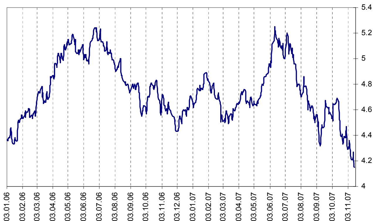
Динамика доходности UST-10, 03 января 2006 – 16 ноября 2007 (правая шкала – в %)

Нестабильная ситуация на рынке акций стимулировала продолжение бегства в безрисковые активы, которое стало причиной дальнейшего роста котировок и снижения доходности американских казначейских облигаций. Доходность десятилетних облигаций снизилась еще на 7 базисных пунктов и достигла 4,15% годовых.