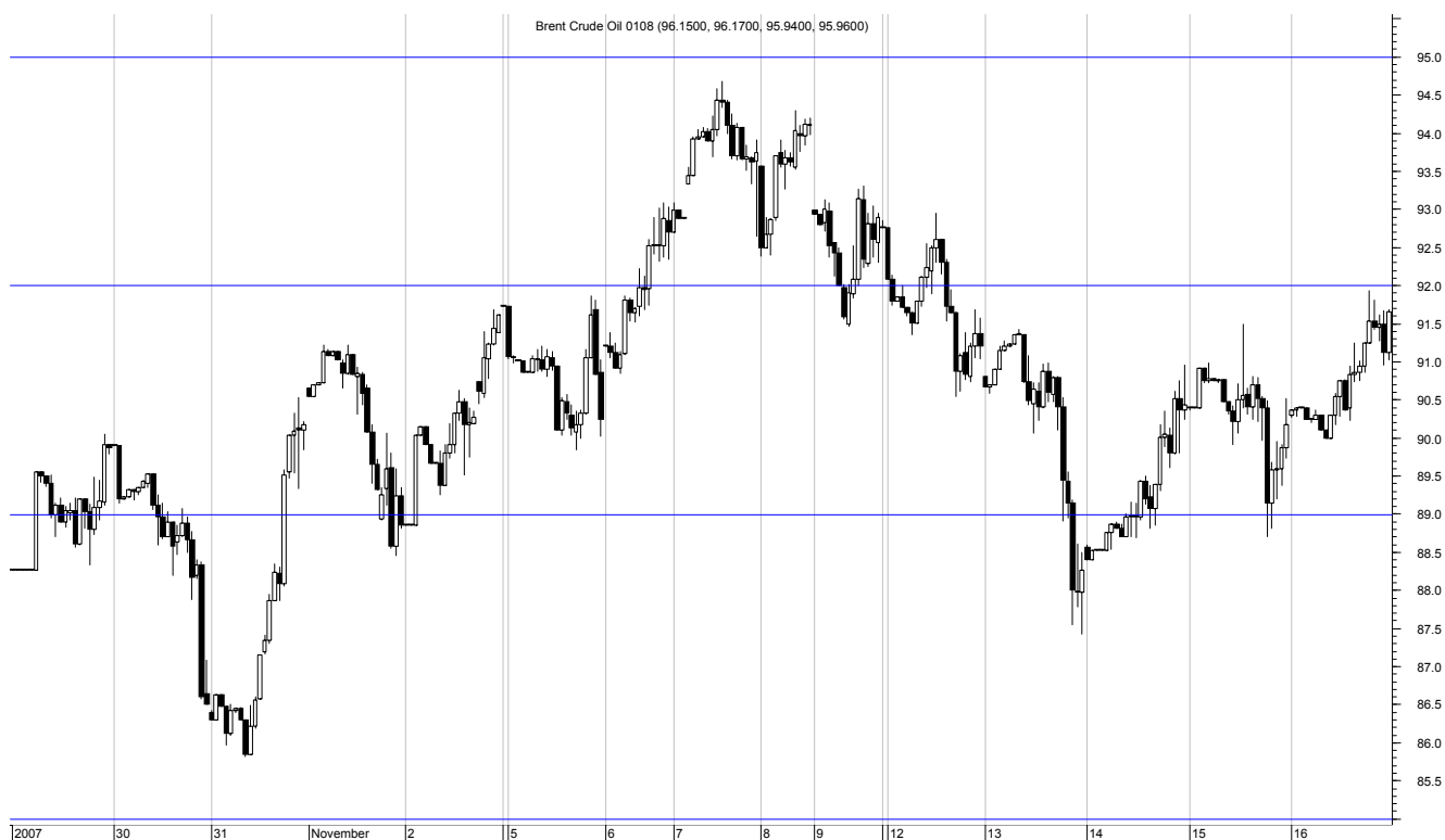
Нефть Brent Crude Oil, 29 октября – 16 ноября 2007

В то же время, во второй половине недели цены на нефть снова демонстрировали растущую динамику, после того как представители ОПЕК опровергли призывы США об увеличении поставок нефти. Восстановлению котировок не помешали даже данные очередного еженедельного доклада министерства энергетики США, зафиксировавшего рост запасов нефти и нефтепродуктов. За неделю, завершившуюся 9 декабря, запасы сырой нефти в США выросли на 2,8 млн. баррелей (прогнозировалось снижение на 0,8 млн. баррелей), запасы бензина выросли на 700 тыс. баррелей (прогноз -100 тыс. баррелей).