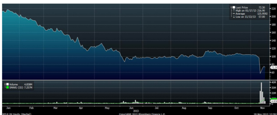
Граф.3 Итоги торгов акциями «Мечела» с начала года

Наиболее заметным событием прошедшей недели стало обвальное падение обыкновенных и привилегированных акций «Мечел» - в среду она обрушились более чем на 41% и 23% соответственно. Технические условия для столь масштабного движения были сформированы в предыдущие торговые дни. Привилегированные акции «Мечела» стабильно дешевели в течение двух последних месяцев. В среду накануне они просели ниже психологически значимой круглой отметки в 45 рублей. Распродажи в обыкновенных акциях наметились на прошлой неделе по факту обнародования слабых производственных результатов «Мечела» за 9 месяцев 2013 года. После пробоя значимой среднесрочной поддержки, располагавшейся в районе 100 рублей, обыкновенные акции «Мечела» ускорили свое падение. Дополнительным негативным сигналом послужили слухи о том, что компания ведет переговоры с банками-кредиторами о продлении «ковантных каникул» до 2015 года и о реструктуризации текущей задолженности. Таким образом, после пробоя значимых поддержек и обновления долгосрочных минимумов, в акциях «Мечела» состоялись панические распродажи, усугубившиеся срабатыванием стоп-ордеров.