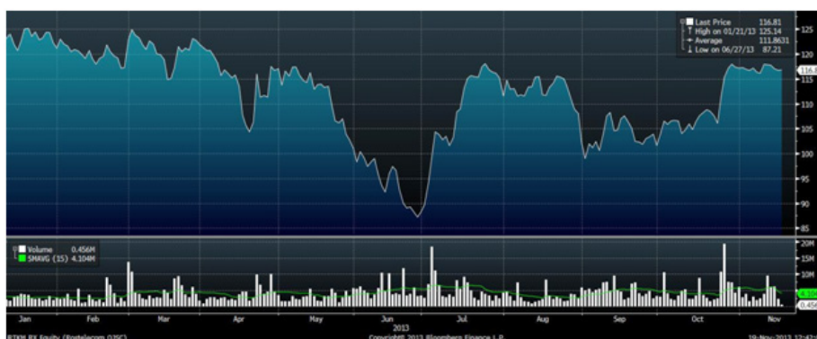
Граф.8 Итоги торгов акциями «Ростелекома» с начала года

Обыкновенные и привилегированные бумаги «Ростелекома» вновь торговались «не в ногу» с рынком. В минувшую среду они сумели неравномерно повыситься против просевшего индекса ММВБ на ожиданиях будущего выкупа акций у акционеров, которые не поддержат реорганизацию компании в форме выделения мобильных активов. В четверг же эти бумаги незначительно подешевели против растущего рынка на фоне публикации слабой бухгалтерской отчетности за 9 месяцев 2013 года по РСБУ. Чистая прибыль «Ростелекома» за отчетный период резко сократилась до 23.585 млрд рублей против чистой прибыли в размере 32.011 млрд рублей за 9 месяцев 2012 года.