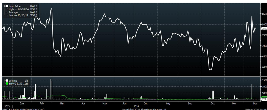
Рис.5 Динамика акций «ВСМПО-АВИСМА» за год