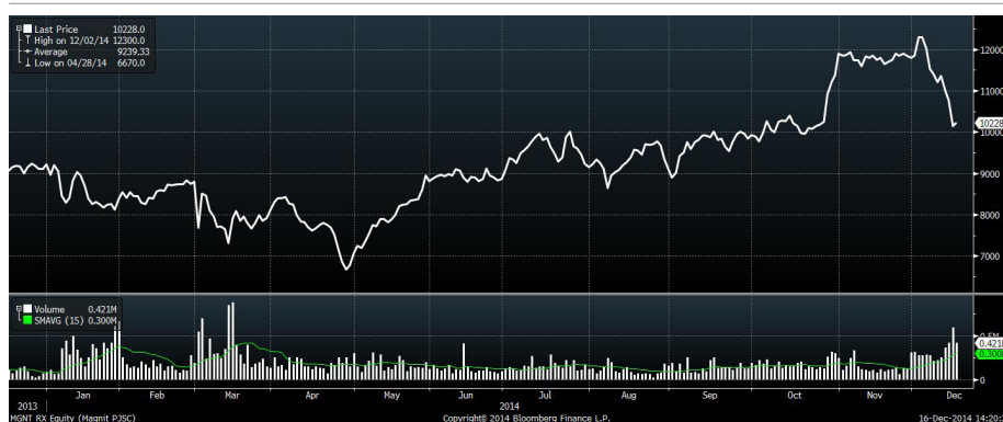
Рис.7 Динамика акций «Магнита» за год

Одним из лидеров падения среди ликвидных бумаг в минувший четверг стали акции розничной торговой сети «Магнит». Они резко просели, несмотря вышедшее в среду сообщение эмитента о приросте торговой выручки за ноябрь 2014 года на 33.17% в рублях. Добавим, что в результате последней волны распродаж среднесрочная техническая картина в этих бумагах заметно ухудшилась. С технической точки зрения, имеет смысл покупать их только после восстановления выше значимого среднесрочного сопротивления, расположенного в районе 12000 рублей.