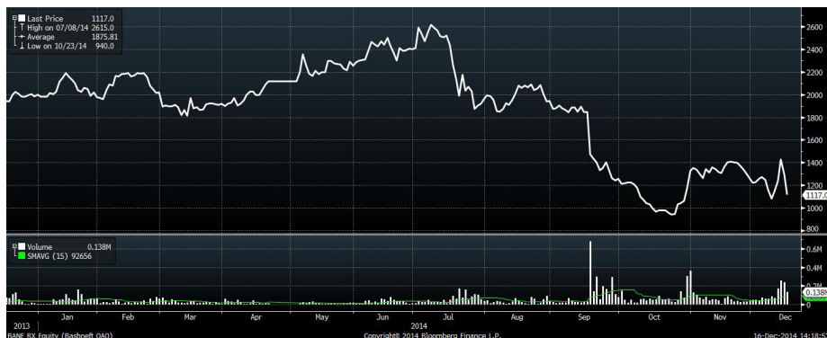
Рис.2 Динамика акций «Башнефти» за год