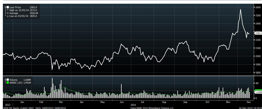
Рис.1 Динамика привилегированных акций «ЛУКОЙЛа» за год

Лидерами прироста в первом эшелоне в минувшую пятницу стали бумаги нефтяной компании «Лукойл». Они достаточно резко отскочили вверх после утреннего обновления среднесрочного минимума. По-видимому, состоявшиеся покупки имели сугубо технический характер. Несмотря на существенное повышение, эти бумаги не смогли закрепиться выше значимого уровня сопротивления, расположенного в районе 2300 рублей.