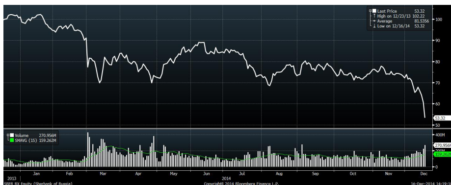
Рис.3 Динамика акций «Сбербанка» за год

В бумагах «Сбербанка» реализуется коррекционный отскок от недавних минимумов. Обыкновенные акции «Сбербанка» имеют потенциал, как минимум, для восстановления в район 70 рублей, считают аналитики ИГ «Норд-Капитал». Общим позитивом для этих бумаг является недавнее заявление президента РФ о возможности докапитализации крупных кредитных организаций за счет фонда национального благосостояния.