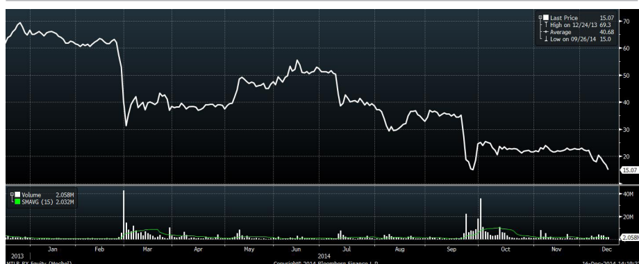
Рис.4 Динамика акций «Мечела» за год

Обыкновенные и привилегированные бумаги «Мечела» вновь подешевели в связи с проблемами перегруженного долгами эмитента. В пятницу стало известно, что один из контрагентов подал иск о банкротстве входящего в группу «Мечел» Челябинского металлургического комбината. Также отягощенная долгами компания опубликовала негативную финансовую отчетность по US GAAP за 9 месяцев 2014. За указанный период «Мечел» сумел лишь сократить чистый убыток в 1.8 раза до уровня в $1.223 млрд против чистого убытка в размере $2.247 млрд годом ранее. Таким образом, эта металлургическая компания остается убыточной. Вместе с тем, ее чистый долг на 30 сентября 2014 года составил $7.84 млрд. Накануне стало известно, что арбитражный суд принял решение о взыскании с «Мечела» почти 3 млрд рублей кредитной задолженности в пользу банка ВТБ. Кроме того, стало известно, что эта кредитная организация требует от металлургической компании досрочного погашения долга в размере 47 млрд рублей. На фоне указанных событий отдельные выпуски облигаций «Мечела» торгуются на уровне 30-40% от номинальной стоимости.