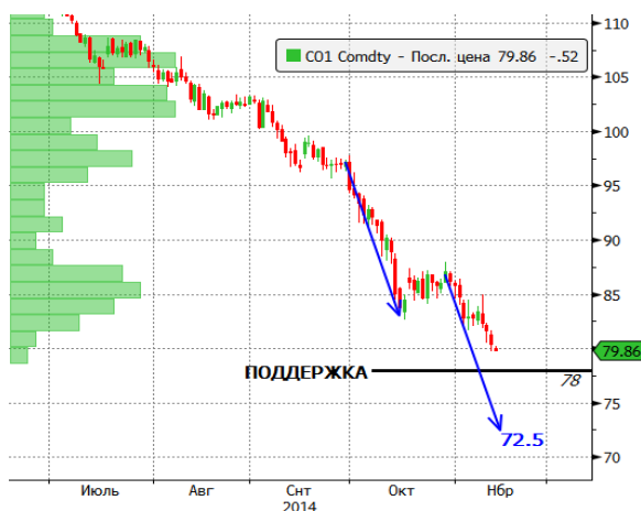
Рис.1 Нефть марки BRENT