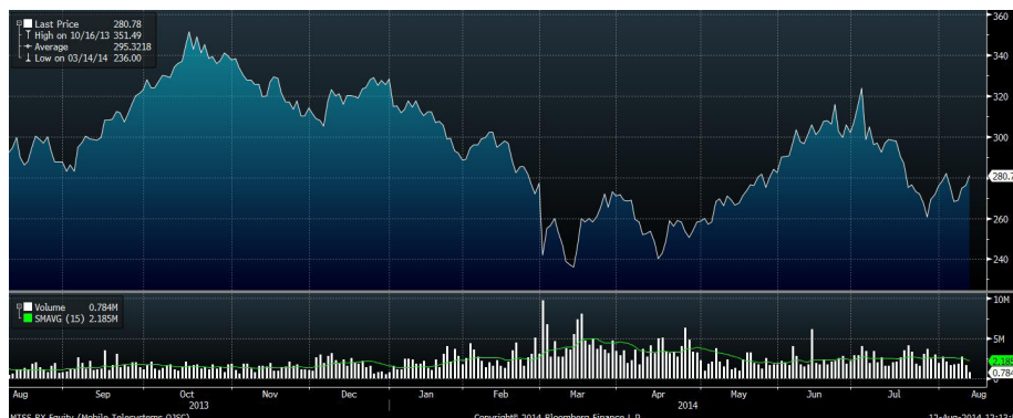
Рис.7 Динамика акций МТС за год