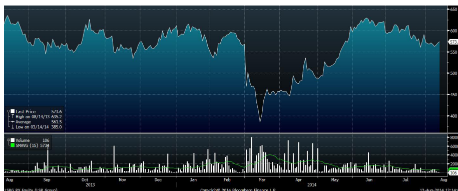
Рис.8 Динамика акций ЛСР за год

Бумаги ЛСР в прошлый вторник сумели избежать падения на фоне сообщения эмитента о начале реализации нового крупного проекта в Москве. Группа ЛСР возведет в столице многоэтажный жилой комплекс общей площадью 990 тыс. кв. м. Строительство нового микрорайона состоится на территории бывшего НПО «Взлёт». Оно будет завершено к концу 2019 года.