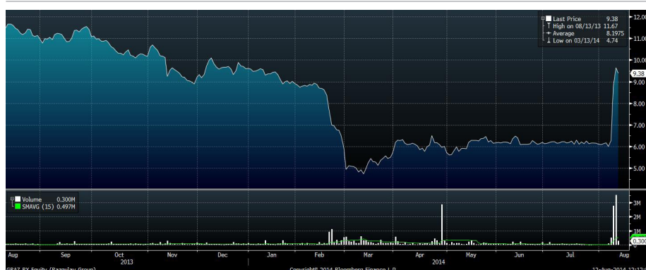
Рис.3 Динамика акций «Разгуляя» за год

Наиболее заметным событием на рынке в конце минувшей недели стал резкий спекулятивный взлет ряда низколиквидных акций продовольственного сектора: «Разгуляя», «Главторгпродукта», «Русского моря», Группы «Черкизово», «Русгрэйна». Масштабные покупки в этих бумагах обусловлены состоявшимся в одночасье улучшением фундаментальных факторов. После недавнего введения годового эмбарго на импорт продовольствия из ряда западных стран отечественные производители продуктов получили уникальный шанс для улучшения своих рыночных позиций.