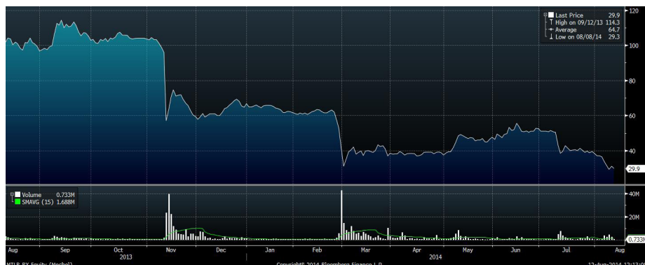
Рис.4 Динамика акций «Мечела» за год