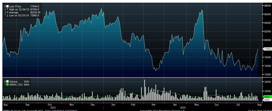
Рис.1 Динамика привилегированных акций «Транснефти» за год