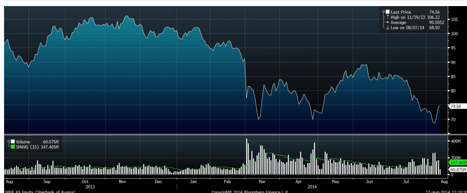
Рис.2 Динамика акций «Сбербанка» за год

В конце минувшей недели аналитики ИГ «Норд-Капитал» обратили внимание на явную слабость российских банковских бумаг, в частности акций «Сбербанка» и ВТБ. Они находились под давлением в связи с ожиданиями возможного исключения из базы расчета фондового индекса MSCI Russia. В случае реализации подобного сценария акции «Сбербанка» и ВТБ подвергнутся еще более масштабным распродажам. Позднее стало известно, что акции «Сбербанка» и ВТБ пока останутся в составе указанного индекса. Вместе с тем, в последние дни акции ВТБ выглядели заметно слабее бумаг «Сбербанка».