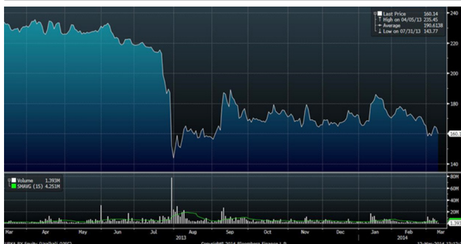
Рис.7 Динамика акций «Уралкалия» за год

Акции «Уралкалия» в конце прошедшей недели смогли заметно опередить рынок в связи с появившимися в СМИ слухами о вероятном возобновлении прекращенного ранее партнерства с «Беларуськалием». Президент Белоруссии Александр Лукашенко опроверг эти сообщения, но подтвердил, что переговоры по этому поводу возможны. После состоявшегося прошлым летом разрыва отношений с иностранным партнером, «Уралкалий» заявил об изменении ценовой политики в сторону максимизации объемов отгрузок по сниженным ценам. Тем не менее, «добрая ссора» оказалась не лучше «худого мира». Так, в результате «калийной войны» отпускная цена на продукцию «Уралкалия» при поставках в Китай в первом полугодии 2014 года сократилась на четверть по сравнению с аналогичным периодом прошлого года - до уровня в $305 за метрическую тонну. Кроме того, в феврале 2014 года российская компания «ФосАгро» сообщила о подписании контракта на поставку хлористого калия с ОАО «Беларуськалий». Выбор столь крупного потребителя в пользу иностранного поставщика стал для «Уралкалия» достаточно тревожным сигналом.