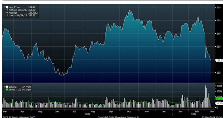
Рис.2 Динамика акций «Газпрома» за год

Акции «Газпрома» на прошлой неделе двигались довольно хаотично, по итогам пяти торговых дней снизившись на 12%. Во вторник премьер-министр РФ Дмитрий Медведев заявил о вероятном выделении Украине кредита величиной в $2-3 млрд для расчетов с «Газпромом» за поставленный газ. Кроме того, стало известно о том, что Европейский союз также готов оказать Украине помощь в выплате долгов за поставки российского газа. Вместе с тем, нельзя сбрасывать со счетов угрозу прекращения или ограничения транзитных поставок топлива в Европу, считают аналитики ИГ «Норд-Капитал». Даже в годы сравнительной политической и экономической стабильности в этой стране имели место случаи несанкционированного отбора газа, предназначенного для западных потребителей.