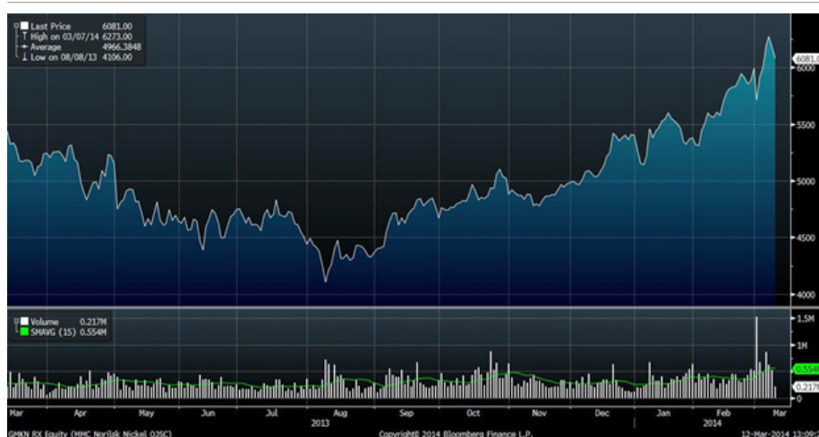
Рис.6 Динамика акций «Норильского Никеля» за год

Акции «Норильского Никеля» в минувший четверг сумели прочно закрепиться выше значимой круглой отметки 6000 рублей, а в пятницу обновили свой долгосрочный максимум. Успешный пробой этого важного сопротивления является позитивным техническим сигналом в пользу дальнейшего роста. На протяжении последнего месяца эти бумаги пользуются поддержкой со стороны сырьевого рынка. Мировые цены на никель заметно повысились после недавнего запрета экспорта необработанных руд из Индонезии.