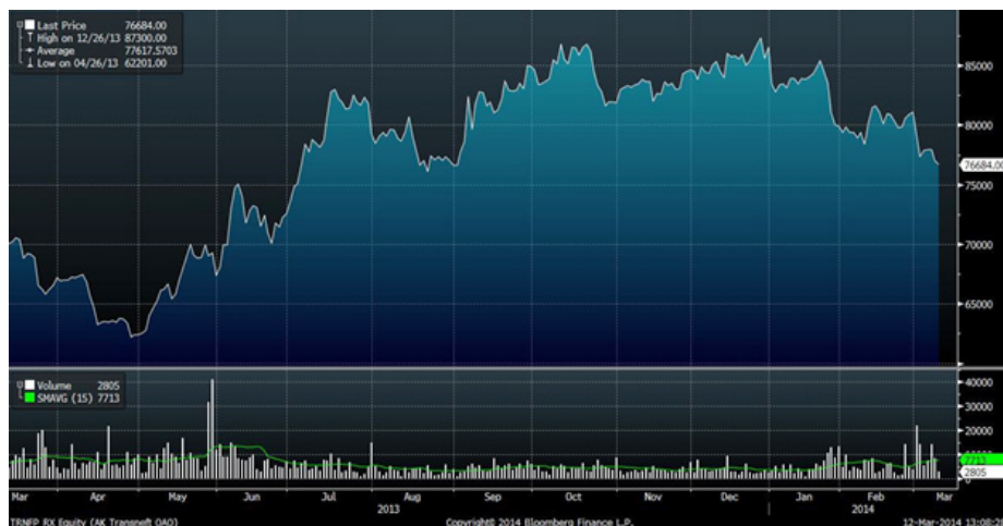
Рис.4 Динамика акций «Транснефти» за год

В начале прошедшей недели «Транснефть» представила отчетность по РСБУ за 2013 год. Годовая выручка компании увеличилась на 2.6% по сравнению с аналогичным периодом прошлого года - до уровня в 704.7 млрд рублей. Чистая прибыль «Транснефти» за 2013 год выросла на 5.7% до уровня в 11.26 млрд рублей.