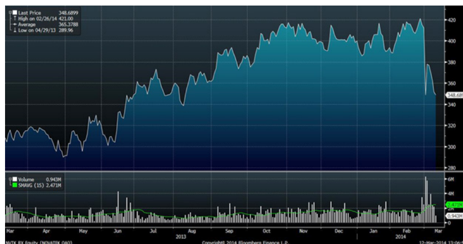
Рис.3 Динамика акций «НОВАТЭКа» за год

Лучше рынка на прошлой неделе выглядели акции «НОВАТЭКа». В течение последнего месяца акции независимого производителя природного газа были заметно сильнее бумага «Газпрома». На фоне «украинского» фактора они стали одним из вариантов «перекладки» из бумага «Газпрома» в другие инструменты. Кроме того, акции «НОВАТЭКа» поддержала недавняя публикация позитивных финансовых результатов эмитента по МСФО за 2013 год.