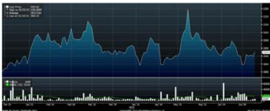
Рис.3 Динамика акций «Башнефти» с начала года

В начале прошлой недели заметным событием во «втором эшелоне» стало существенное повышение обыкновенных и привилегированных акций «Башнефти». Эти бумаги восстанавливались от своих долгосрочных минимумов. Поводом для недавних распродаж стали не подтвердившиеся слухи об интересе «Роснефти» к поглощению эмитента.