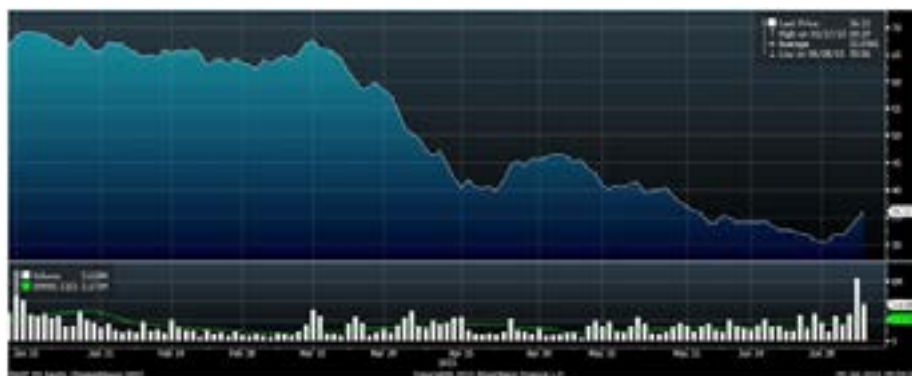
Рис.5 Динамика акций «Распадской» с начала года

В прошлую пятницу перепроданные акции «Распадской» получили импульс к повышению в связи с сообщением эмитента о возобновлении работ на одноимённой шахте. «Распадская» была остановлена 14 мая текущего года в связи с превышением содержания окиси углерода в пробах воздуха. В настоящее время угольная компания выполнила необходимые мероприятия, направленные на обеспечение безопасных условий труда. Аналитики ИГ «Норд-Капитал» не исключают, что эта позитивная новость станет сигналом для перелома долгосрочной нисходящей тенденции в бумагах «Распадской».