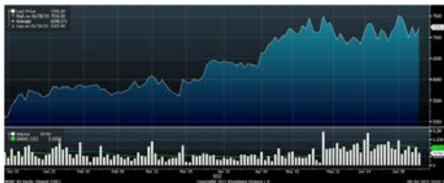
Рис.9 Динамика акций «Магнита» с начала года

Лидером падения среди наиболее ликвидных бумаг в пятницу стали акции «Магнита». В последние дни эти бумаги отличаются повышенной волатильностью. После недавнего обновления долгосрочного максимума (7600 рублей) они нашли локальную поддержку в районе 6950 – 7000 рублей. На недельном графике акции «Магнита» выглядят существенно сильнее индекса ММВБ и имеют технический потенциал к возобновлению среднесрочного повышения. Устойчивый рост торговой выручки и непрерывное расширение розничной сети являются объективными аргументами для долгосрочного роста курсовой стоимости её ценных бумаг.