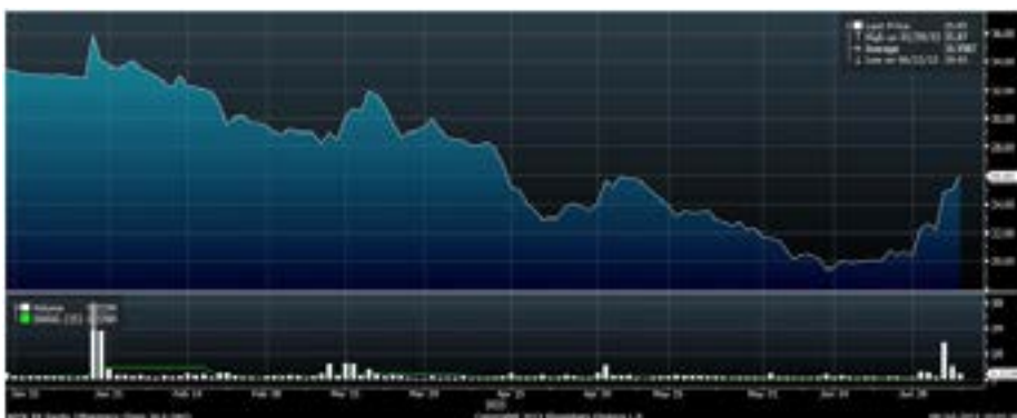
Рис.7 Динамика акций «Аптечной сети 36.6» с начала года

Наиболее заметным событием среди бумаг «второго эшелона» в минувший четверг стал резкий взлет акций «Аптечной сети 36.6». Поводом для их роста стало сообщение о том, что аптечная сеть привлекла пятилетний кредит у Московского Кредитного Банка на сумму в 10 млрд рублей под залог акций своей «дочки» ЗАО «Фармстэйт». Привлеченные средства будут направлены на рефинансирование задолженности компании перед другими банками и на пополнение оборотного капитала.