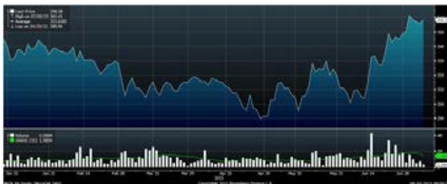
Рис.2 Динамика акций «НОВАТЭКа» с начала года

Бумаги «НОВАТЭКа» во вторник получили новый импульс к повышению в связи с принятием Госдумой РФ в первом чтении законопроекта о формуле НДПИ на газ. В случае окончательного принятия этого закона налоговая нагрузка на независимых производителей газа уменьшится. Добавим, что с середины июня в акциях «НОВАТЭКа» сформировалась среднесрочная восходящая тенденция. Ближайшей значимой целью и сопротивлением для этих бумаг выступает отметка 380 рублей.