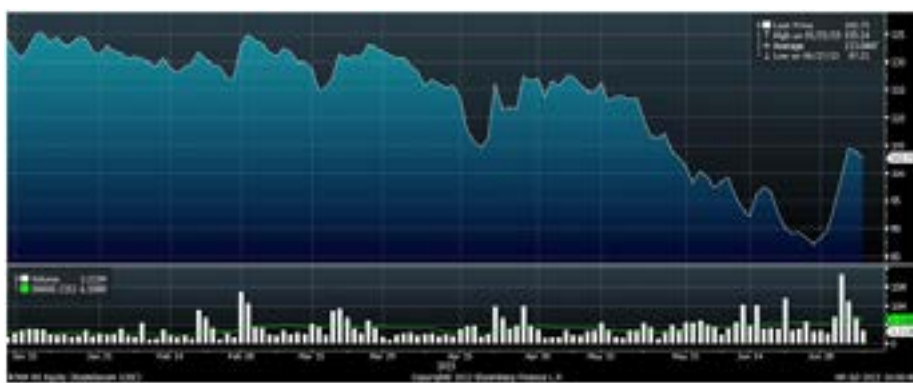
Рис.8 Динамика акций «Ростелекома» с начала года

В прошлый четверг опережающим приростом на повышенных оборотах отличились обыкновенные акции «Ростелекома». Текущая активизация покупок связана с новостью о том, что Рос – сийский фонд прямых инвестиций и Deutsche Bank приобретут у дочерней компании эмитента пакет квазиказначейских акций стоимостью в 250 млн долларов. Кроме того, играет роль новость о том, что акционеры «Ростелекома» поддержали реорганизацию компании в форме присоединения «Связьинвеста» и ряда дочерних обществ. Уменьшение неопределённости, связанной с этим длительным и непростым процессом, в свою очередь, повышает инвестиционную привлекательность акций «Ростелекома».