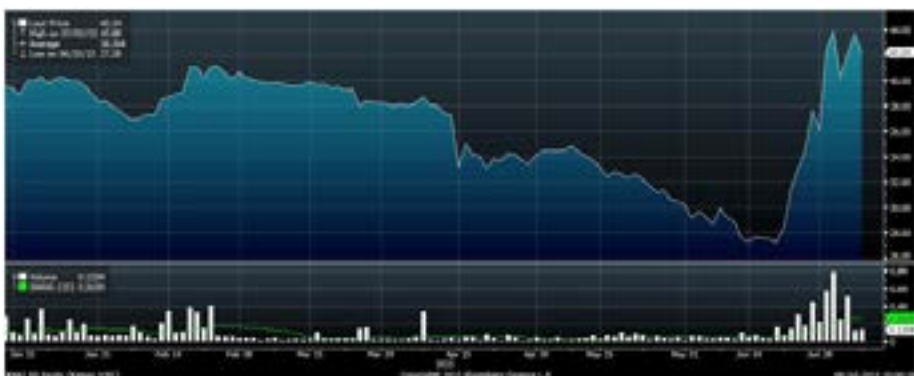
Рис. 6 Динамика акций «КАМАЗа» с начала года

Наиболее заметным событием во «втором эшелоне» на прошлой неделе стало возобновившееся повышение акций «КАМАЗа». Эти бумаги растут под влиянием новости о решении годового общего собрания акционеров автопроизводителя впервые за 20 лет выплатить дивиденды в размере 69 копеек на одну обыкновенную акцию. Кроме того, стало известно о том, что литовская компания «Аутобаги», занимающаяся сборкой российских грузовиков под брендом «КАМАЗ» из российских комплектующих, реализовала первую партию из восьми автомобилей. Сигналом для начала недавней волны покупок акций «КАМАЗа» послужила новость о состоявшемся подписании соглашения о сотрудничестве между ОАО «КАМАЗ» и министерством чрезвычайных ситуаций РФ. Соглашение предполагает масштабные поставки специализированной автотранспортной техники за счет бюджета страны.