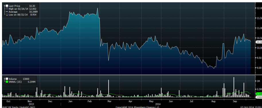
Рис.6 Динамика акций «АВТОВАЗа» за год

Продажи LADA в сентябре 2014 года на российском рынке выросли на 38% м/м до 36 513 автомобилей. Наибольший прирост дали семейства LADA Kalina (+33%) и LADA Granta (+42,7%). При этом 14 283 автомобиля LADA были реализованы в рамках программы утилизации. Именно эта программа российского правительства позволила «АВТОВАЗу» выправить свои показатели. Опасения, что российский автомобильный рынок по итогам года упадет на 20%, уменьшаются. Вероятно, падение будет в пределах 10-15%, считают аналитики ИГ «Норд-Капитал».