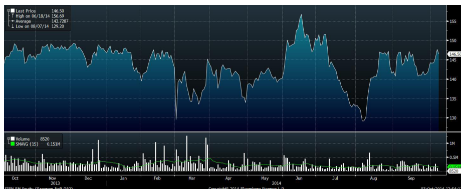
Рис.2 Динамика акций «Газпром нефти» за год