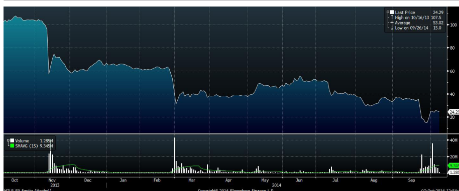
Рис.4 Динамика акций «Мечела» за год

Со знаком плюс на прошедшей неделе аналитики ИГ «Норд-Капитал» отметили многострадальный «Мечел». В начале прошлой недели акции компании почти полностью отыграли 60% снижения недель ранее. Бумаги поддержало заявление помощника президента России Андрея Белоусова, что близко заключение компромисса с кредиторами. Наиболее вероятный сценарий - конвертация долгов компании в акции. При этом банки настаивают на получении суммарного контрольного пакета (75%), а доля Игоря Зюзина снизится. В ответ он предлагает альтернативный вариант: реструктуризацию долгов по невысокой ставке с возможностью гасить тело кредитов. Аналитики ИГ «Норд-Капитал» ожидают, что переговоры придут к консенсусу в ближайшие дни.