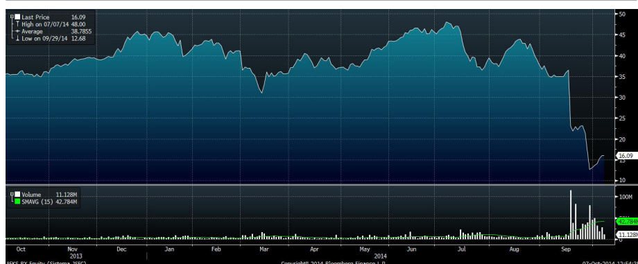
Рис.3 Динамика акций АФК «Система» за год

Московская биржа на прошлой неделе сообщила, что выявила признаки манипулирования акциями АФК «Система». Материалы переданы в ЦБ для дальнейшего расследования. За последний месяц на фоне ареста Владимира Евтушенкова и акций «Башнефти», принадлежащие АФК «Система», бумаги последней упали на 60%. Инвесторы опасаются пересмотра итогов приватизации башкирского ТЭКа и уменьшения дивидендов «Башнефти». В какой-то момент появилось сообщение об освобождении Евтушенкова, но в дальнейшем оно было опровергнуто. Когда происходят такие события, реакция рынка всегда эмоциональна, и доказать факт манипулирования будет непросто.