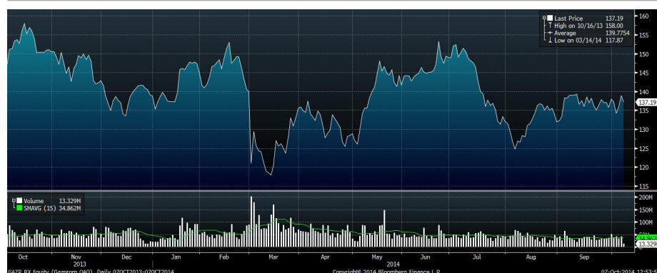
Рис.1 Динамика привилегированных акций «Газпрома» за год

На прошлой неделе между украинским премьер-министром Арсением Яценюком и «Газпром» возник небольшой спор по газовому вопросу. До конца текущего года «Нафтогаз» должен погасить $3.1 млрд долга, в том числе $2 млрд — до конца октября. Видимо, сложнее пойдут газовые переговоры в формате Россия-ЕС-Украина (очередной раунд запланирован на текущей неделе). Шансы на снятие санкций в отношении России со стороны Евросоюза в конце октября уменьшаются, а ввод новых — наоборот, может быть не за горами, считают аналитики ИГ «Норд-Капитал»..