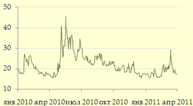
Volatility index (VIX)